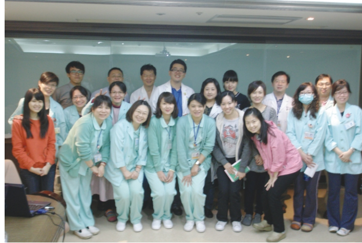
兒童發展聯合評估團隊

在發展兒童的早期療育工作中，發展評估是一大重點。無論是確定孩子是否有發展遲緩，或是想瞭解孩子的發展是否已達到一般兒童發展的水準，都需要仰賴評估。