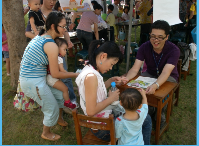
新住民及偏遠地區發展篩檢