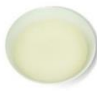
粥湯/肉湯/魚湯/菜湯