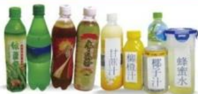
無渣飲料/無渣果汁