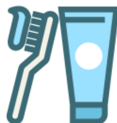
口腔清潔衛生不好