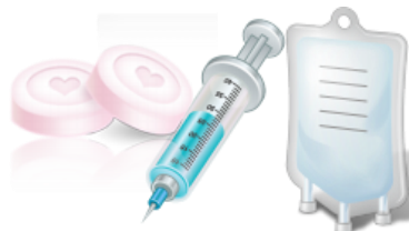
化學、類固醇治療、抗血管新生療法