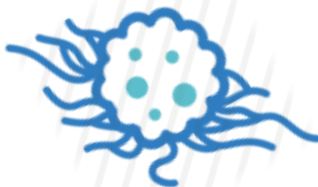
多發性骨髓瘤、乳癌、攝護腺癌、肺癌...等